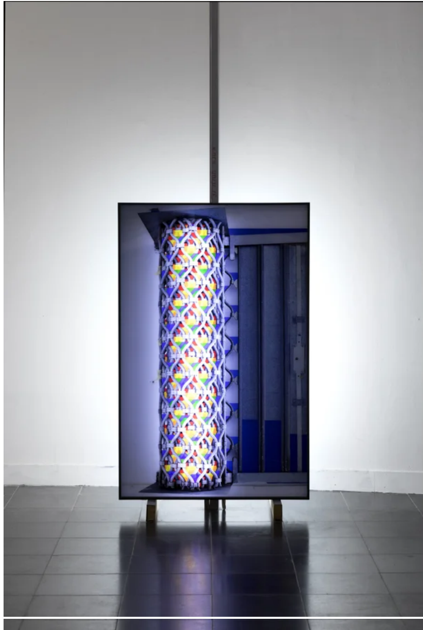
"ספר תורה", 2020

אחריות, להיתלות במדדים שלא אנחנו קבענו, שאינם קשורים לקריטריונים הפרטיים שלנו, ולנסות להתמקם בתוכם. בימים אלו מודדים בכל רגע נתון נדבקים, חולים, מונשמים, מובטלים, חיוניים ולמעשה כמעט כל דבר. בו בזמן זה נהיה מאוד ברור שאין לנו לא הבנה אמיתית של המגפה ולא שליטה בה".