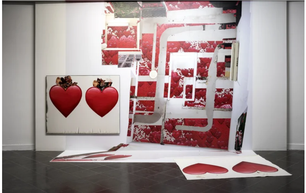
"לבבות ותקרה", 2020

מאוד סטודנטים ערבים בבצלאל וחשתי שהם נתבעים על ידי המערכת לייצר עמדה פוליטית ברורה. הכפייה הזאת הסתיימה בזכות הריבוי"