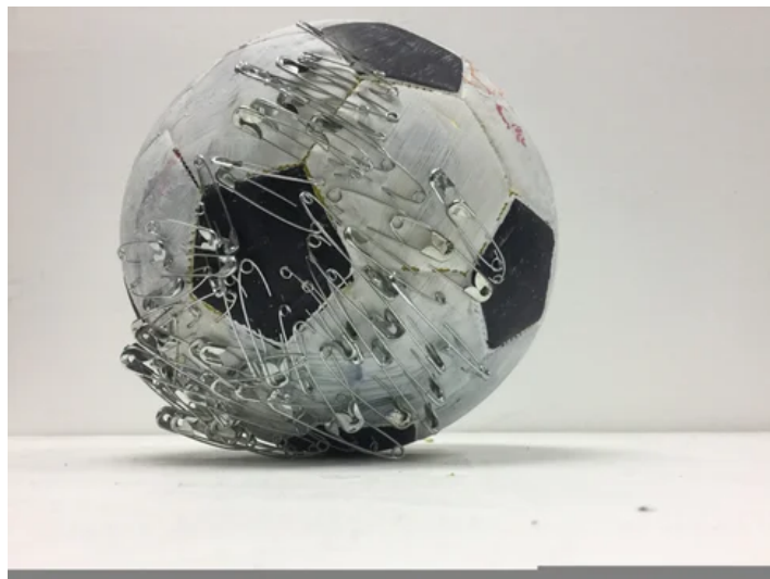
פרט מתוך המיצב

מעניין להתבונן בתערוכה של אברגיל במוזיאון לאמנות יחד עם זו שמוצגת במקביל במבנה הסמוך - המסגד העותמאני שהוסב, לאחר מאבק ארוך, למוזיאון לתרבות האיסלאם ועמי המזרח: "בסוף מערב: אמנות ואומנות מארצות המגרב: מרוקו, אלג'יריה, תוניסיה" (אוצרת: שרון לאור־סירק). בהתאם למסורת התצוגה האתנוגרפית, מציעה התערוכה מקבץ של תכשיטים, קמיעות, קופסאות, כלי קרמיקה וחרבות מצפון אפריקה - חפצים ייחודיים מן העבר, מתרבויות רחוקות, כל אחד נושא בתוכו סיפור; פריטים היסטוריים, שהיו חלק מטקסים חברתיים (תפילה, התקשטות, לחימה) אך יצאו מכלל שימוש ומוצגים כעת במוזיאון לבחינה מרוחקת, אסתטית.