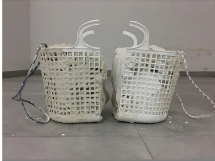
פרט מתוך המיצב

של קופפרמן, עם המעגלים של תמר גטר. בחלל הזה היא מסמנת את אופן ההגעה אל נוסח הפיסול שלה, כמעבר מן הרישום והציור אל החפץ: כדי להעמיד את פקעות החפצים היומיומיים, עליה לשלול ראשית את הצורה המופשטת, את הקו והמעגל, וכן את המכחול או העט ככלי יצירה. את המכחול היא תולה, מן הבד היא מנביטה קערה, במוזיאון היא מעמידה מחסן.